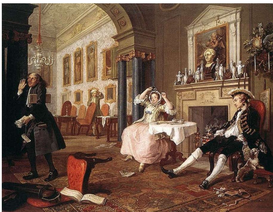
Одна из сцен живописной пьесы

Живописные пьесы – это серии картин, объединенные сюжетной линией, в живописной форме повествующие о судьбах персонажей различных социальных слоев, раскрывающие типичные неблагоприятные и подчас трагические явления действительности того времени. Каждая серия завершается ярко выраженной морализирующей концовкой.