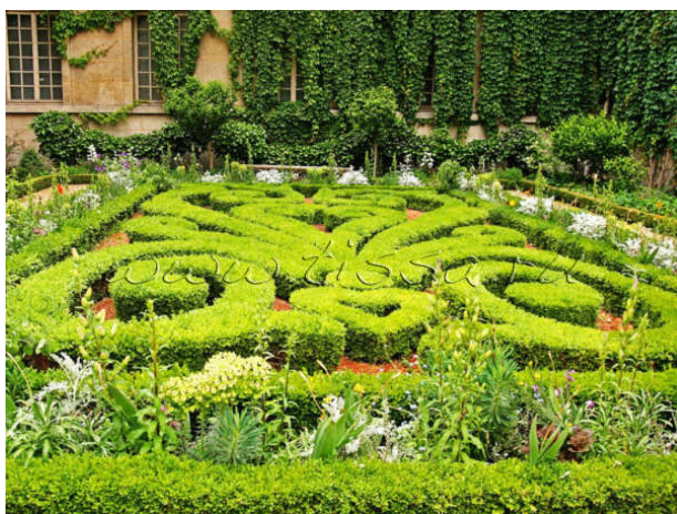
Французский регулярный парк

Французский регулярный парк во второй половине XVIII века вытесняется в Англии ландшафтным, в котором композицию образуют свободные группы деревьев, открытые лужайки и озера с извилистыми берегами.