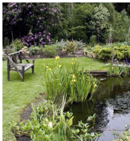
Английский ландшафтный парк

Французский регулярный парк требует больших территорий и постоянного кропотливого ухода. Взамен человек получает возможность выразить свои амбиции. Английский парк – используется ландшафт окружающей природы.